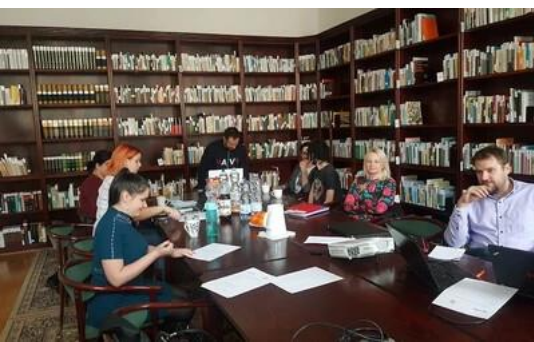
Az egyik korábbi műhelymunkán résztvevő fiatalok

FELHÍVÁS SZABÓ T. ATTILA-ÖSZTÖNDÍJRA – A TERMINI EGYESÜLET PÁLYÁZATOT HIRDET „A MAGYAR NYELV ÉS A TUDOMÁNYOK – SZABÓ T. ATTILA-DÍJRA” – A SzTA-Díjat 2016-ban alapították olyan 45 év alatti szakemberek munkájának elismerésére, akik eddigi pályájukon külön figyeltek a magyar tudományos szaknyelvük igényes használatára, fejlesztésére és ápolására. A díjat a Magyar Nyelvtudományi Társaság (MNYT) iktatta díjai közé, és a Magyar Nyelvészeti Kutatóállomások Hálózatának (TERMINI) elismeréseként ítéli évente oda (oklevél + Laudációk + emléktáblácska (plakett) + egy boríték az ösztöndíj összegével). A SzTAD jelölés, illetőleg pályázás alapján ítélt oda. Jelölni a sztud.termini@gmail.com címen lehet ... A következő díjra 2024. február végéig lehet jelölni /pályázni a sztud.termini@gmail.com E-címen. Az ösztöndíj odaítéléséről a SzTAD Kuratóriuma március 15-ig dönt. A Kuratórium az értékelés során elsődlegesen azt veszi figyelembe, hogy jelölt/pályázó milyen mértékben teljesíti a fenti feltételek valamelyikét http://termini.nyud.hu/